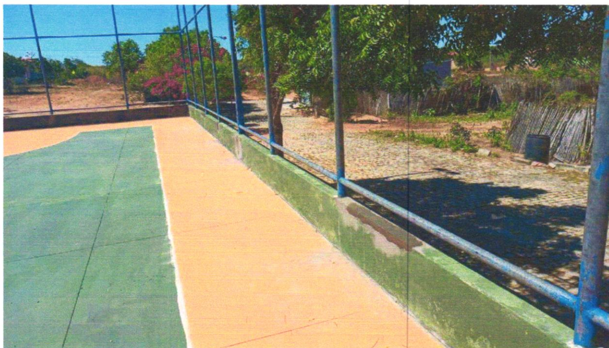
Foto 03 – ALVENARIA DE VEDAÇÃO DE BLOCOS CERÂMICOS FURADOS NA VERTICAL DE 9X19X39 CM (ESPESSURA 9 CM) E ARGAMASSA DE ASSENTAMENTO COM PREPARO EM BETONEIRA. AF_12/2021