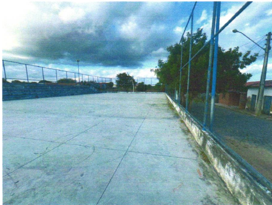
Foto 01 - PISO EM CONCRETO 20 MPA PREPARO MECÂNICO, ESPESSURA 7CM. AF_09/2020