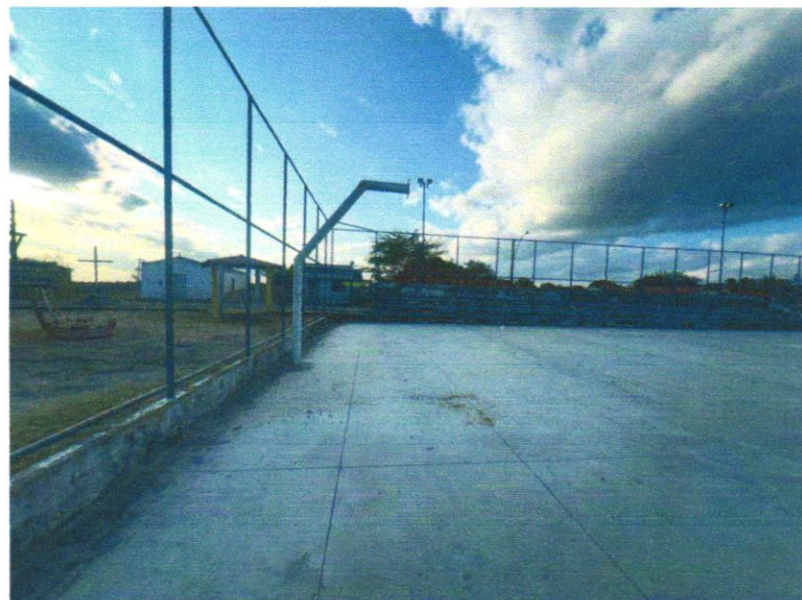
Foto 02 – PISO EM CONCRETO 20 MPA PREPARO MECÂNICO, ESPESSURA 7CM. AF_09/2020