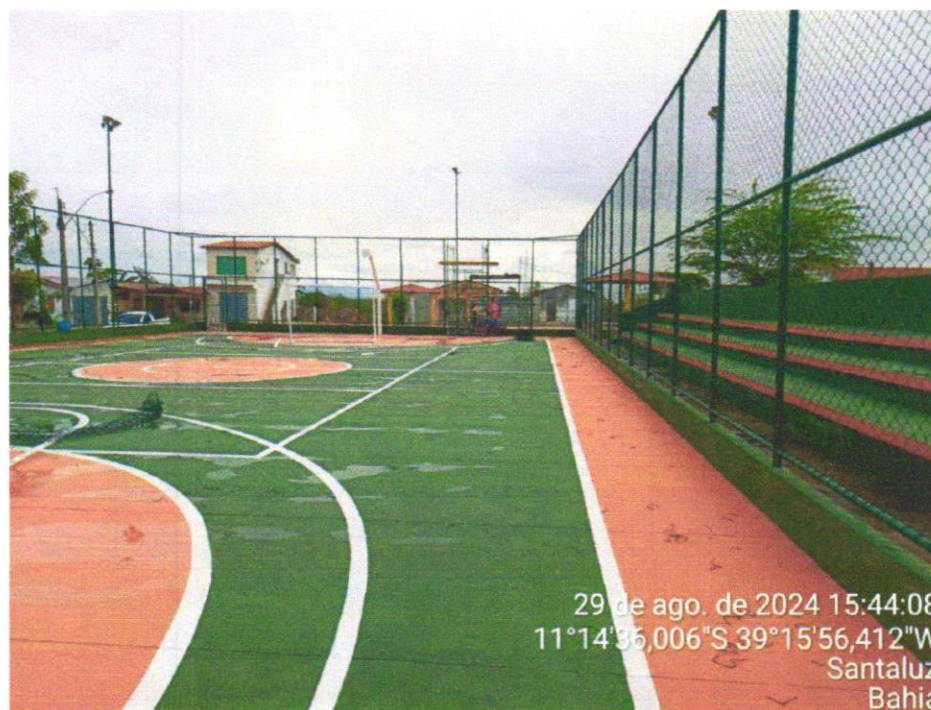
Foto 07 - PINTURA DE PISO COM TINTA ACRÍLICA, APLICAÇÃO MANUAL, 2 DEMÃOS, INCLUSO FUNDO PREPARADOR. AF_05/2021