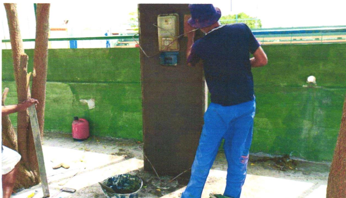
Foto 04- MASSA ÚNICA, PARA RECEBIMENTO DE PINTURA, EM ARGAMASSA TRAÇO 1:2:8, PREPARO MANUAL, APLICADA MANUALMENTE EM FACES INTERNAS DE PAREDES, ESPESSURA DE 10MM, COM EXECUÇÃO DE TALISCAS